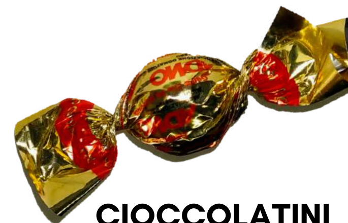
CIOCCOLATINI MISTI LATTE/FONDENTE

Confezionati in box trasparente da 120 gr con etichetta personalizzata ADMO Offerta minima € 8,00