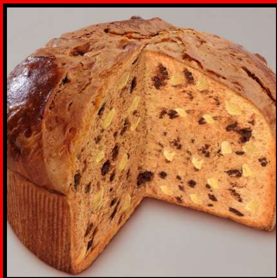
PANETTONE BASSO CIOCCOLATO E PERE 750 gr Offerta minima € 14,00